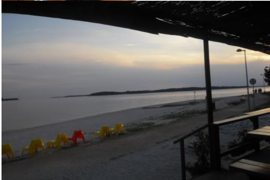
Gute Nacht und schläft gut.