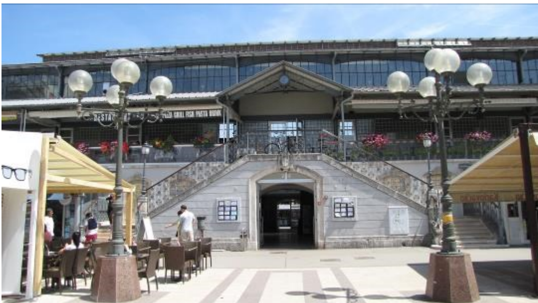
Die Markt halle.