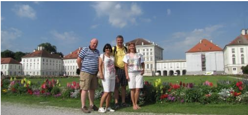
Gruppenfoto bei schönstem Wetter.