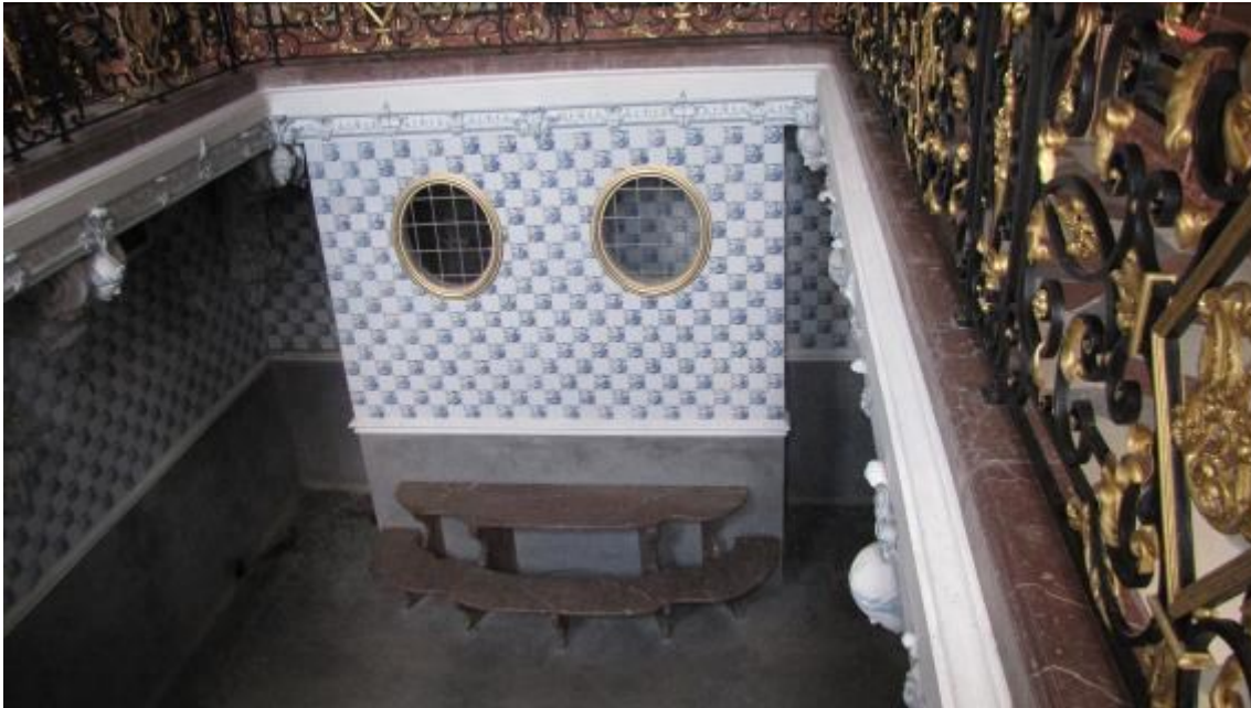
Beheizbarer Pool in der Badenburg