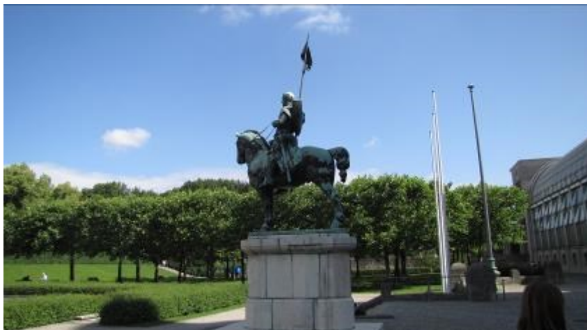
Haus der Kunst.